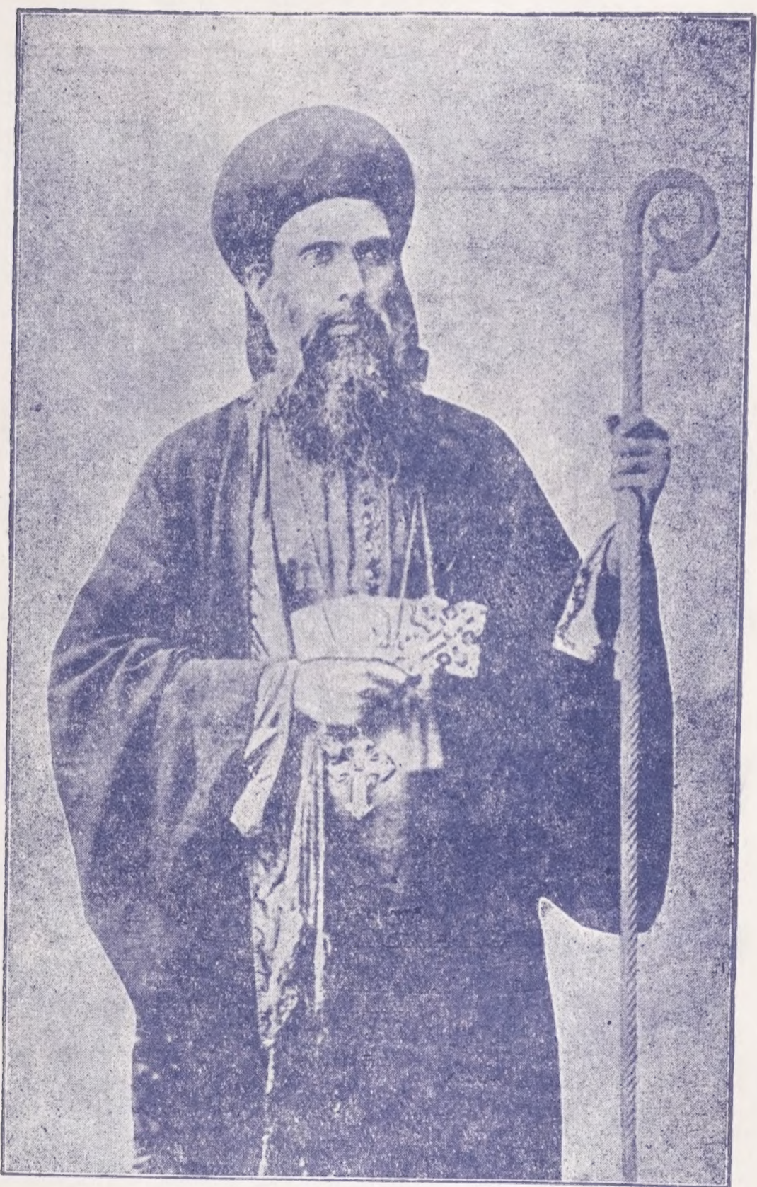
പത്തമലൈ-കാലംചെയ്ത വിശുദ്ധ മാർ ഗ്രിഗോറിയോസ് തിരുമനസ്സുകൊണ്ടു്.