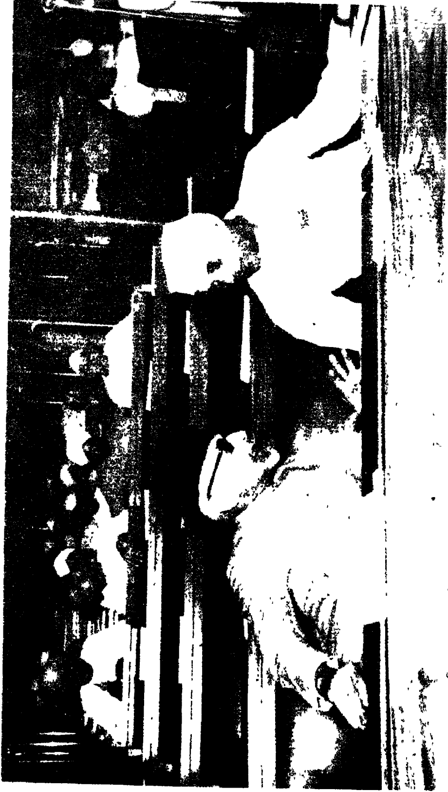
सविधान सभा के सत्र के दौरान मोलाना अबुल कलाम आजाद और पंडित जवाहरलाल नेहरू