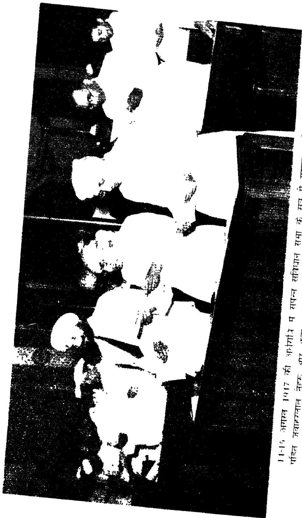
14-15 अगस्त 1947 की असीर्गात्रि में सपन्न सविधान सभा के सत्र में सपदार बलदेव सिन्हा, पंडित त्रिवाहनलाल नेहरू और अन्य